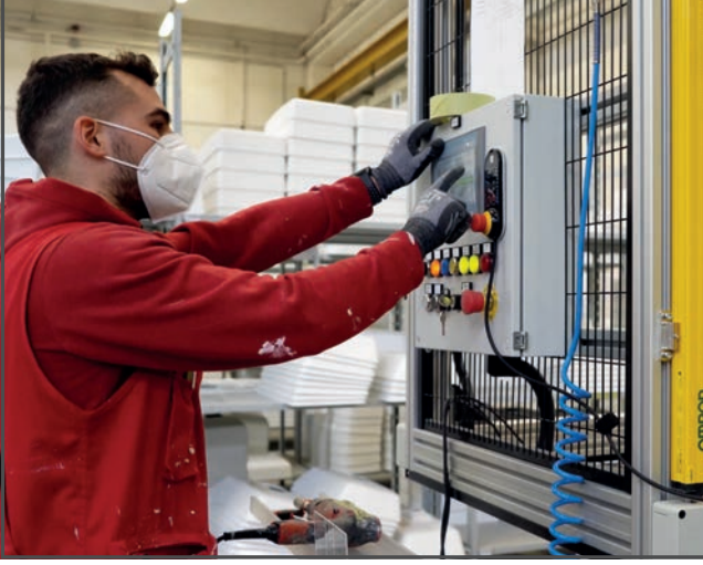
Topcustom, cobotu kullanmanın sonucu olarak üretimini %15 artırdı.