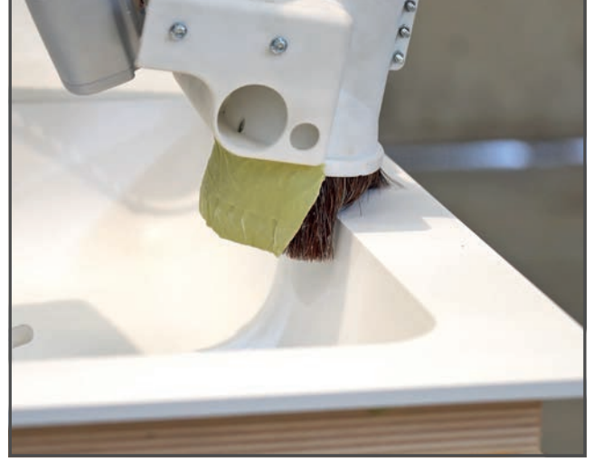
İlk siparişten bitmiş ürünün teslimatına kadar tüm süreç, manuel işçilik ile mümkün olmayan bir hassaslık ve tekrarlanabilirlik seviyesi ile iki hafta içinde yönetilebilir.