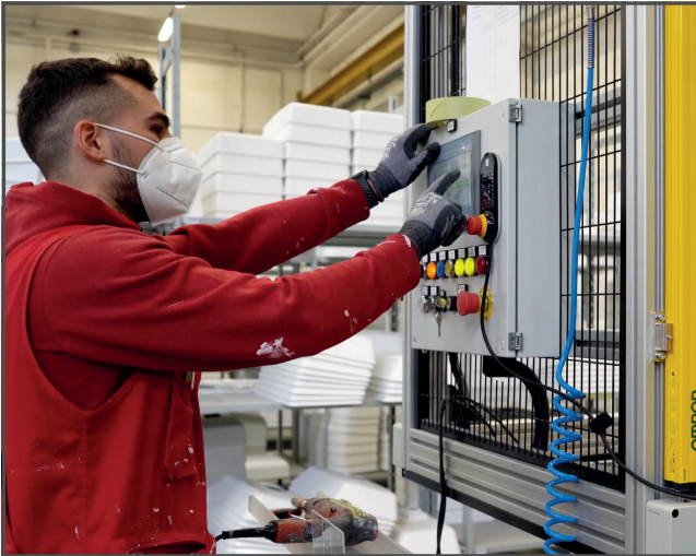
Grazie all'impiego del cobot, Topcustom s.r.l. ha incrementato del 15% la sua produzione.