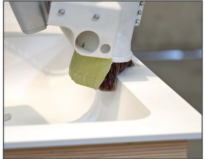
Un ordine completo può essere gestito in due settimane, con una precisione e un livello di ripetibilità non raggiungibile con un intervento umano.