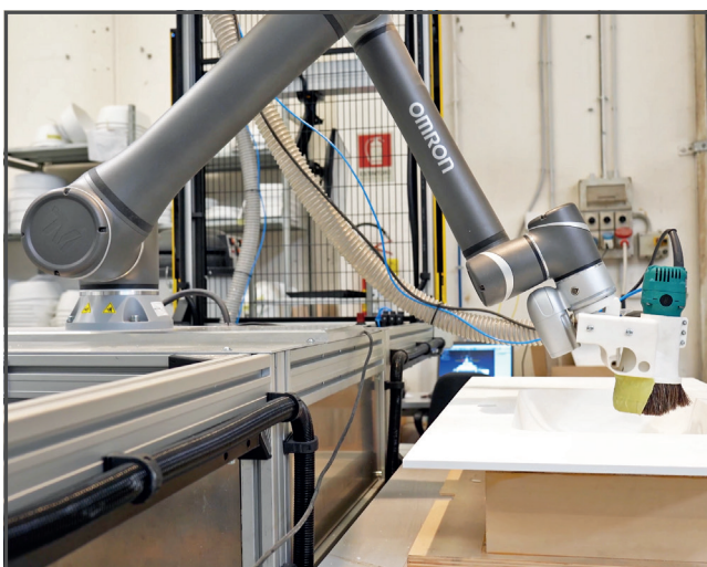
Topcustom ha recentemente deciso di impiegare un cobot per automatizzare tutte le operazioni di finitura dei suoi prodotti in Ocritch.

L'apertura al mondo dell'Industria 4.0 consente inoltre a Topcustom di poter sfruttare in futuro l'integrazione dei dati di produzione, creando una corrispondenza fra i codici prodotto e i programmi di lavorazione associata.