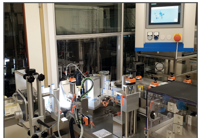
La caméra intelligente FHV7 offre des fonctionnalités d'éclairage et de traitement de l'image pour des inspections visuelles optimisées.