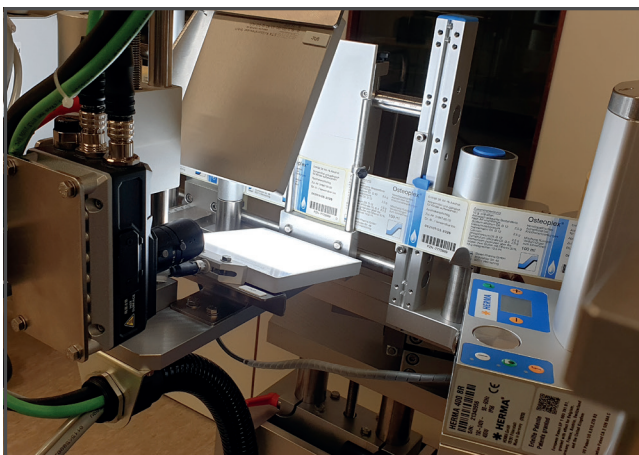
Grâce au système d'inspection FHV7, la machine d'étiquetage HERMA de Steierl-Pharma vérifie l'identité de l'étiquette en se basant sur le code pharmaceutique et contrôle le lot et la date de péremption.

Steierl-Pharma est une entreprise pharmaceutique de taille moyenne spécialisée dans le domaine de la naturopathie et produisant des médicaments à posologie liquide, vendus dans des flacons cylindriques en verre. Cette entreprise,