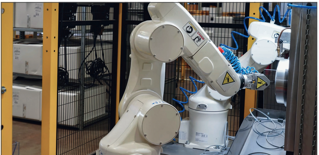
La finalidad principal de la nueva celda de robot era la de reducir los tiempos de acabado de las juntas e incrementar la versatilidad general del proceso.