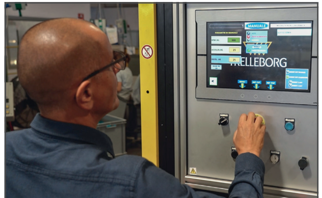
Gracias a Sysmac Studio, Trelleborg puede programar los distintos elementos mediante una única solución.

componentes, lo que nos facilita la búsqueda de averías. Tener el control total de la automatización nos permite disfrutar de versatilidad en nuestras actividades y de una ventaja enorme en lo que a formación respecta. Con una solución todo en uno, mantener a nuestro personal actualizado con las últimas novedades es más sencillo».