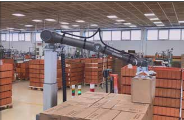
El nuevo cobot RC-1 tiene un alcance de hasta 1300 mm y puede soportar una carga útil de hasta 14 kg.