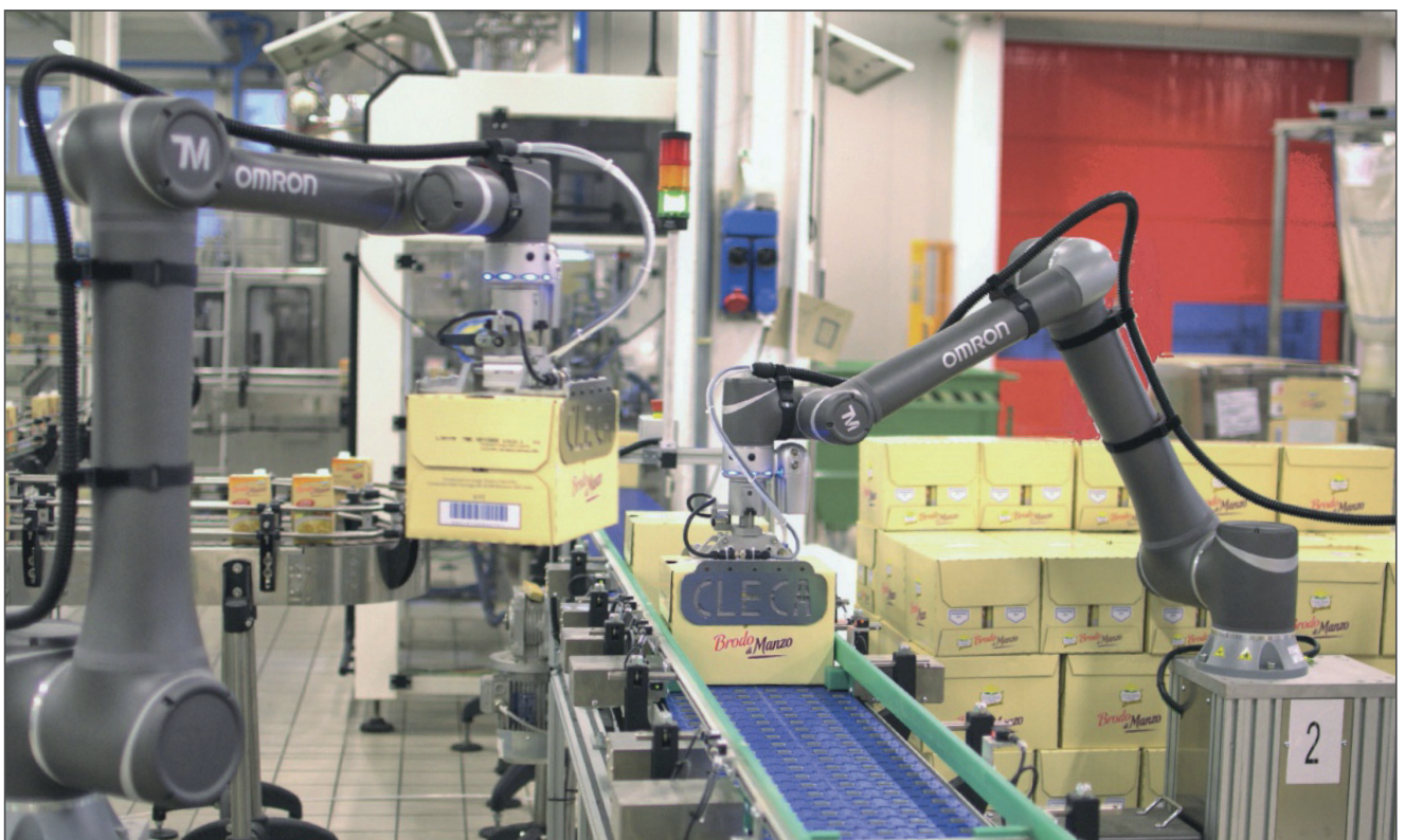
Die TM12-Cobots von OMRON haben eine Nutzlast von 12 Kilogramm und eine Reichweite von 1.300 Millimetern. Sie haben CLECA geholfen, Automatisierung und Produktivität voranzutreiben.