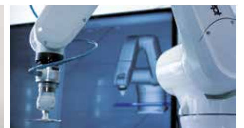
Asistencia en las instalaciones