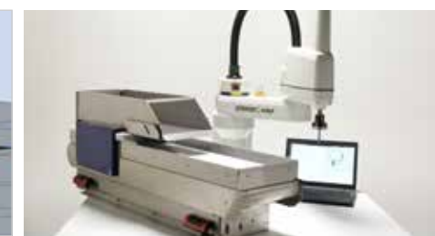
Estudio de viabilidad real